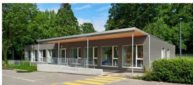
Crèche de l'Hôpital de Cery du CHUV (clinique psychiatrique).