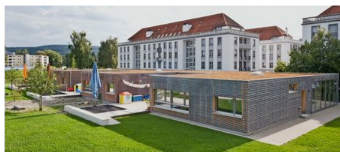
Crèche de l'EMPA à Dübendorf (ZH). Gataric Zeljko