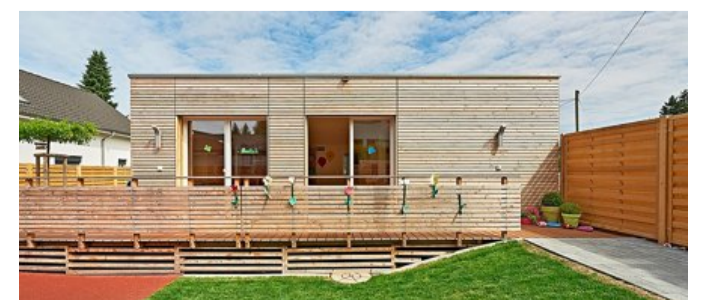
Crèche réalisée pour la Commune de Schöftland (AG).