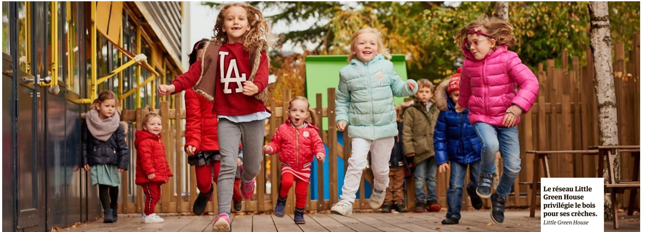
Le réseau Little Green House privilégie le bois pour ses crèches. Little Green House

En dix ans, le coût actualisé du kWh solaire a baissé de manière spectaculaire.